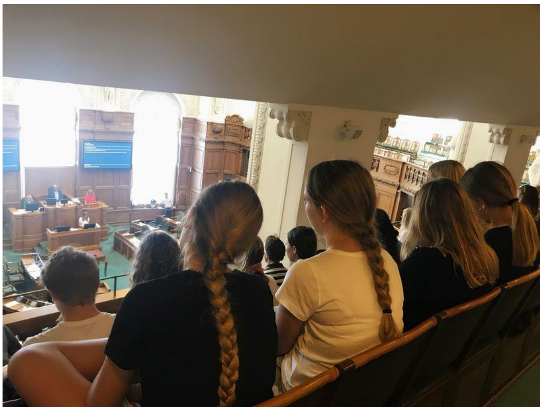
8A på tilhørerpladserne i Folketinget, hvor vi overværede en debat om de mange test unge i folkeskolen bl.a. skal igennem.

Hvad betyder det for vores demokrati her i Danmark, at Folketinget i overvejende nær fremtid, kun har karrierefremmende typer repræsenteret på pladserne?